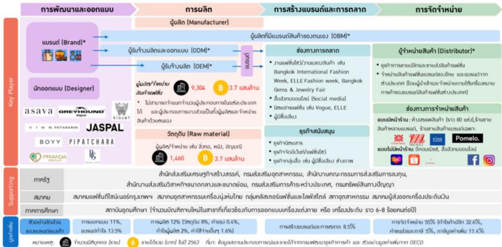
ภาพที่ 1 ระบบนิเวศของอุตสาหกรรมสินค้าแฟชั่น